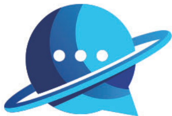
■ユニルムンド様ロゴ・ロゴタイプ