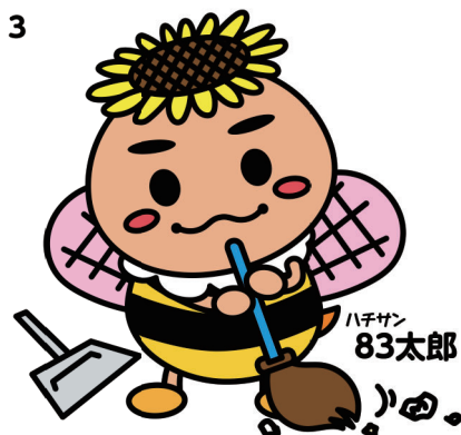
■横浜市港南区地域振興課キャラクター